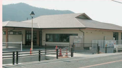
看護小規模多機能 すずかぜ