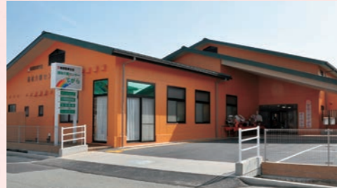
看護小規模多機能 てがら