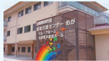
小規模多機能ホーム めが