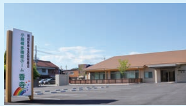
小規模多機能ホーム 香寺