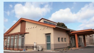
小規模多機能ホーム 城北