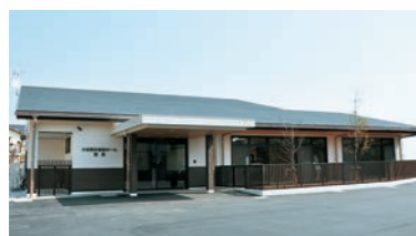
小規模多機能ホーム 野里