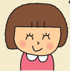
なじみの スタッフが対応