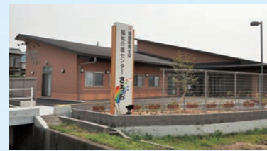
小規模多機能ホーム さろお