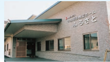
小規模多機能ホーム ふるさと