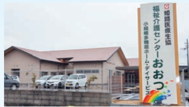
小規模多機能ホーム おおつ