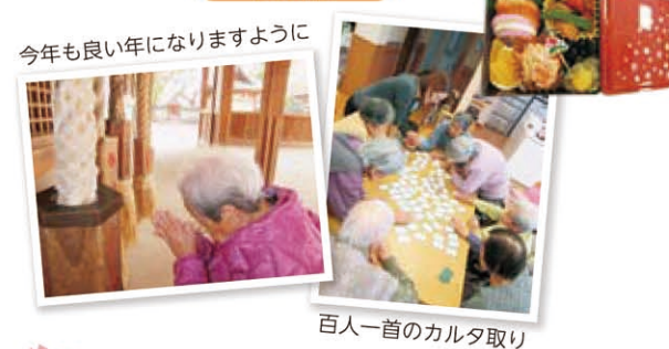
今年も良い年になりますように