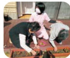
センター敷地にて、ご利用者様と一緒に季節の野菜やお花を栽培しています