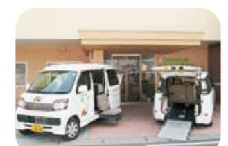
助手席リフトアップ車両・車イス対応型車両で送迎します