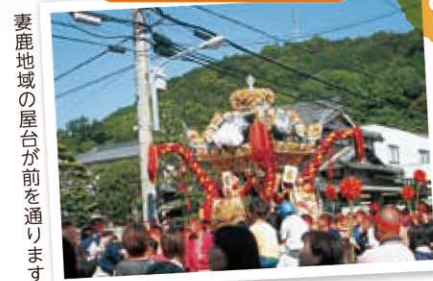
妻鹿地域の屋台が前を通ります