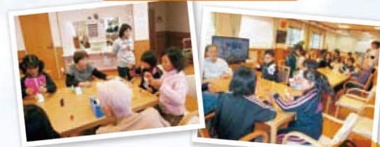
小学生とのふれあいで笑顔がこぼれます