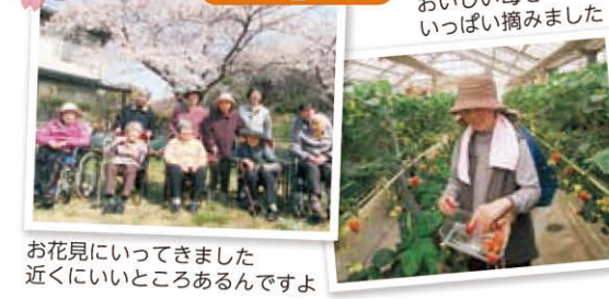
お花見にきました 近くにいいところあるんですよ