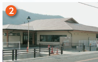
2 小規模多機能ホームすずかぜ 姫路市砥堀630 TEL 079-265-3865