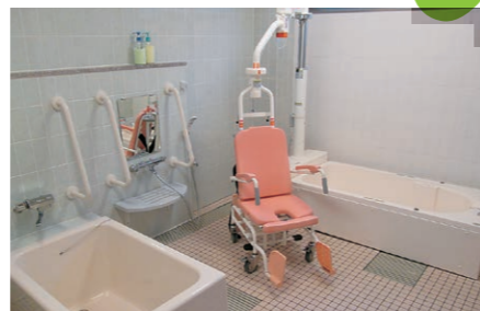
様々な身体状況に応じて入浴できる浴槽を完備しています。