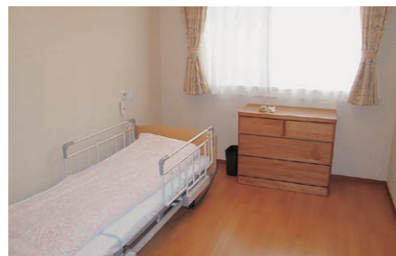
全室個室の宿泊室で、ベッドと寝具が備わっておりあります。