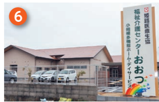
6 小規模多機能ホームおおつ 姫路市大津区天満1047-1 TEL 079-238-5303