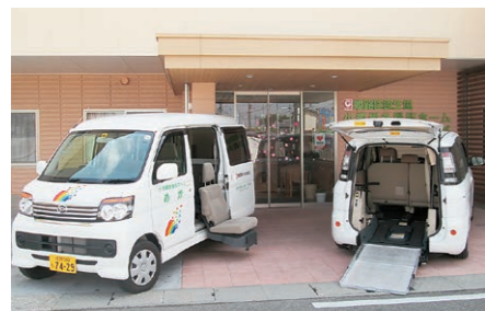
リフトアップ車両・車椅子対応車両で送迎いたします。