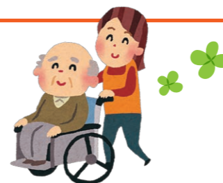
「生活リハビリ」で身体機能の維持・向上を図ります。