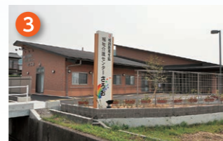
3 小規模多機能ホームさろお 姫路市飾東町佐良和32-1 TEL 079-252-8023