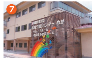
7 小規模多機能ホームめが 姫路市飾磨区妻鹿278 TEL 079-247-3211