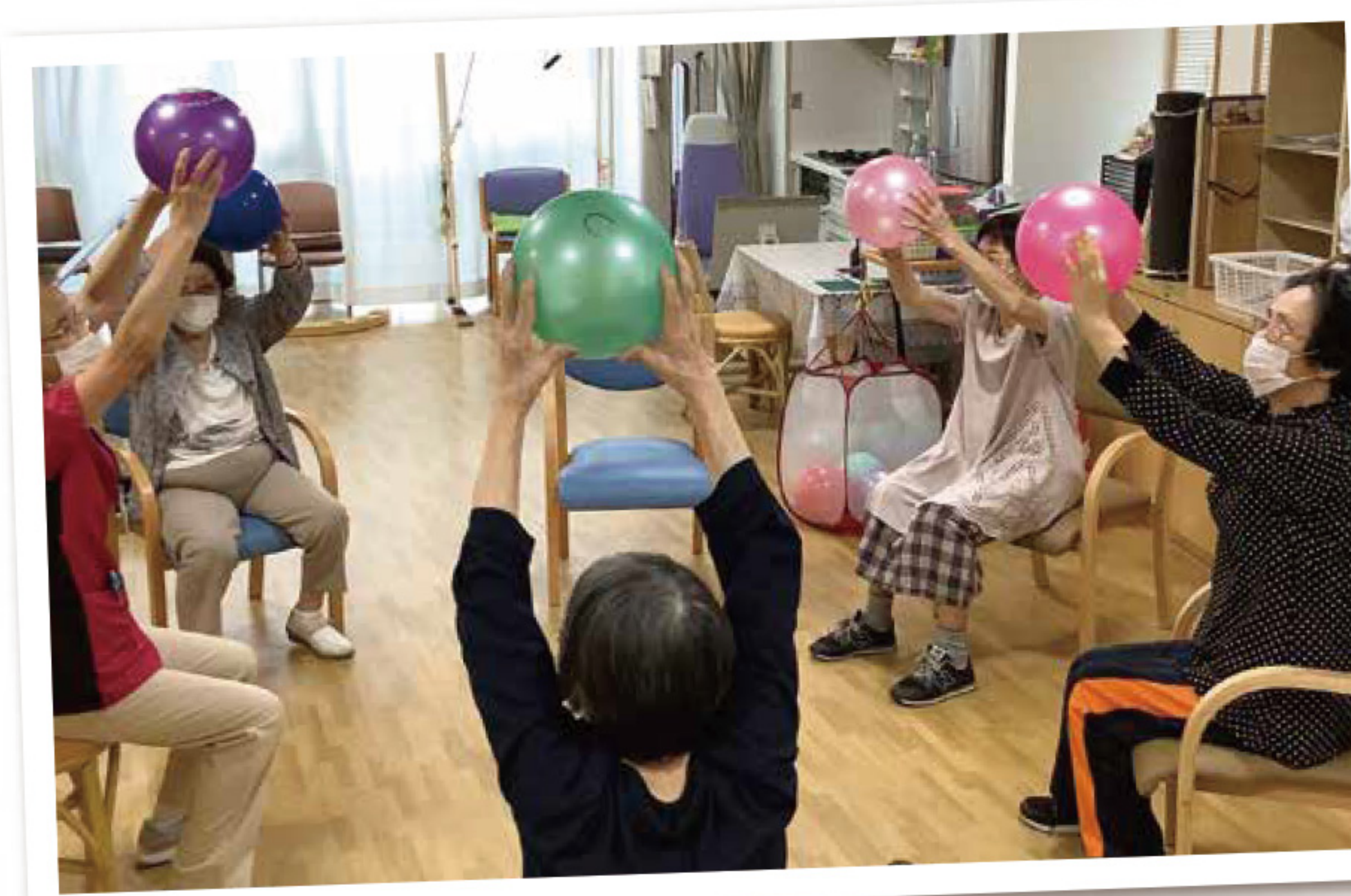
セラピストによる 機能訓練