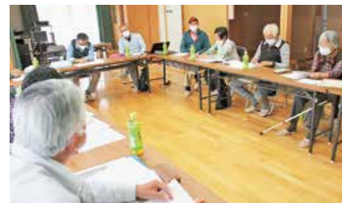
皆さん必ず発言するのが太子支部スタイル