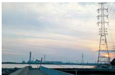
▲木場ヨットハーバーの防波堤から見る夕日