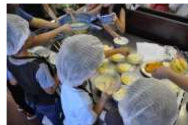
高砂支部 みんなの食堂(子ども食堂)