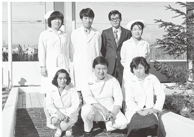
▲開設当時の職員(1975年)