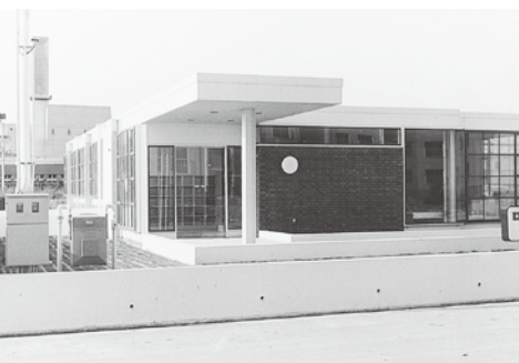
▲完成した共立診療所(1975年)

での役割をしっかりと果たせる病院であってほしいなあ。最近は地域や組合員との繋がりが弱くなっているように思うから。地域には色んな専門家がいますから、もっと繋がりをつくってそういう人たちの力も借りながら、組合員と職員が協同の力ですすめてほしいね。