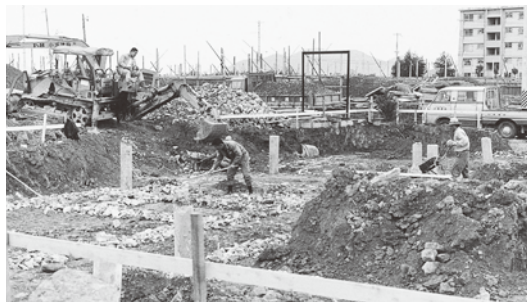
▲「共立診療所」建設がスタート(1974年)

満足に診てくれる医療機関は少なく、労働者や市民は困った。大阪や神戸で民医連の病院や診療所が活躍していたけれど、姫路にはなかったから姫路にも民主診療所をつくらうという動きができたんです。