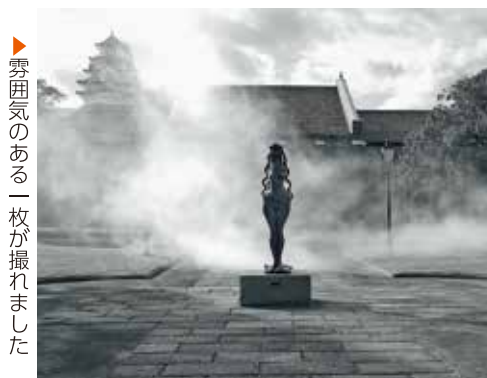
▶ 雲囲気のある一枚が撮れました

現在は、前庭で庭園アートプロジェクト『霧の彫刻』《白鷺が飛ぶ》を開催中です(来年3月12日まで)。人工が放つ霧と自