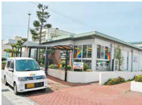
▲取り壊す直前までレンタル市川台に