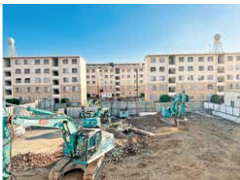
▲解体された旧診療所。長い間お疲れ様でした