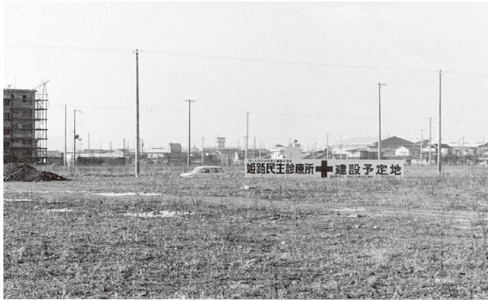
▲当時の市川台。まだ市川団地も建っていませんでした

されました。1970年代にかけて公害問題や労災職業病の問題が蔓延しとって、姫路も例外ではなかった。でも