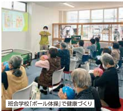
班会学校「ボール体操」で健康づくり

4月には、姫路医療生協で2ヶ所目となる白鷺・琴陵地域包括支援センターを受託開設しました。地域のみなさんの総合相談窓口の役割を担い、