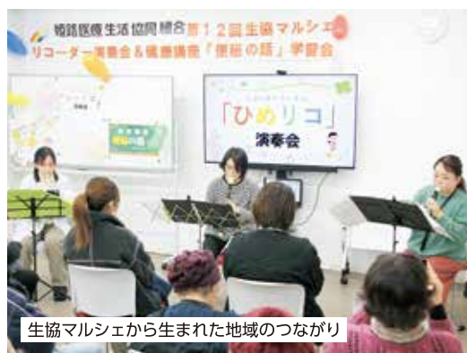
生協マルシェから生まれた地域のつながり